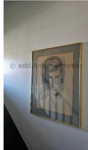
Quelques photos d'ambiance du Cabinet d'amateur, photographies © Laura Wester