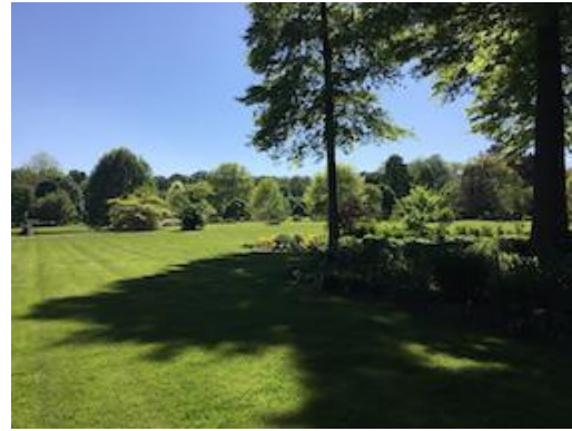
Quelques images d'ambiance de la visite à l'Arboretum Wespelaar le 6 mai 2018